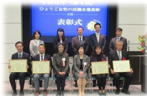
表彰式 (R1. 12. 3)