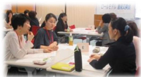
ロールモデル意見交換会