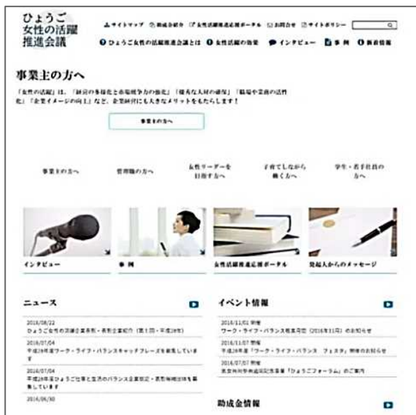
ホームページトップ画面