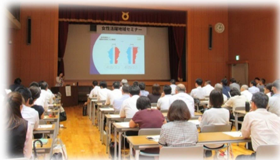
地域セミナー（R1. 8. 28）

〔内 容〕 講演「女性が活けると、生産性が上がる！」 講演「男性が変われば、会社が変わる！」 パネルディスカッション「但馬でもできる！ワークイノベーション」