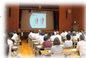
地域セミナー（R1. 8. 28）